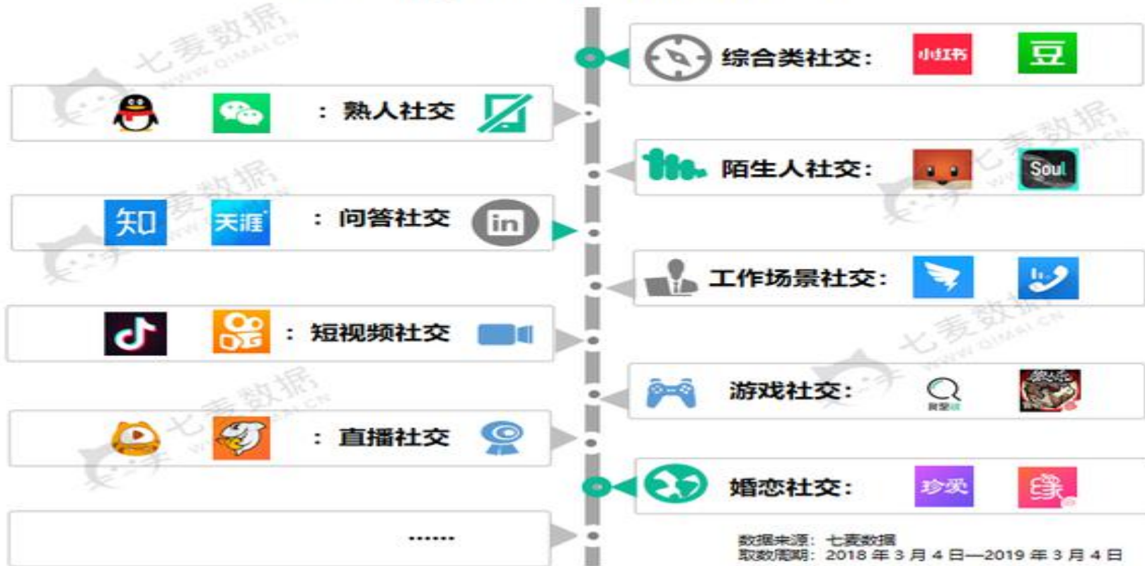
社交类 App 领域细分情况 (iOS 端)

垂直类产品近年来的发展趋势较好，App Store中社交类App大致上可以分为但不限于以下九类。目前，用户流量的大蛋糕已经被巨头吃下，但仍有小部分的用户市场还未被开发，开发者深入垂直领域，更易吸引用户的关注。再加上年轻一代用户的思想更加开放，对于不同产品都具有极大的包容性，如对Soul、陌陌这类陌生人社交App充满好奇。